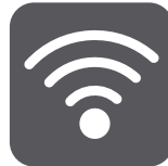
TELECOMUNICACIONES Y REDES